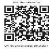
Scan for Payment