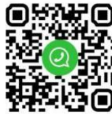
Scan for What'sapp