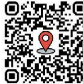
Scan for Location