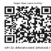
Scan for Payment